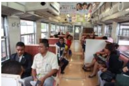
Traveling by train