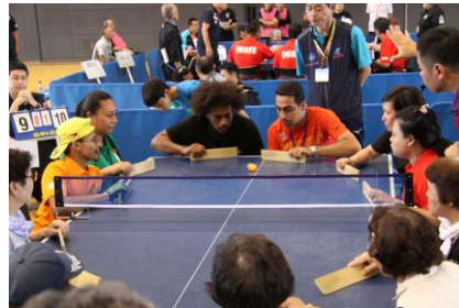
Takkyu Volley Tournament