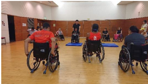
Instruction of Sports Introduction through Daily Wheelchair

JICA содействует международному общению между участниками JICA и местными сообществами. Просьба к участникам привезти свои национальные костюмы, небольшие подарки и наглядные пособия, такие как видео и фотографии, чтобы представить свои страны.