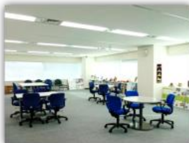
JICA Plaza Tohoku