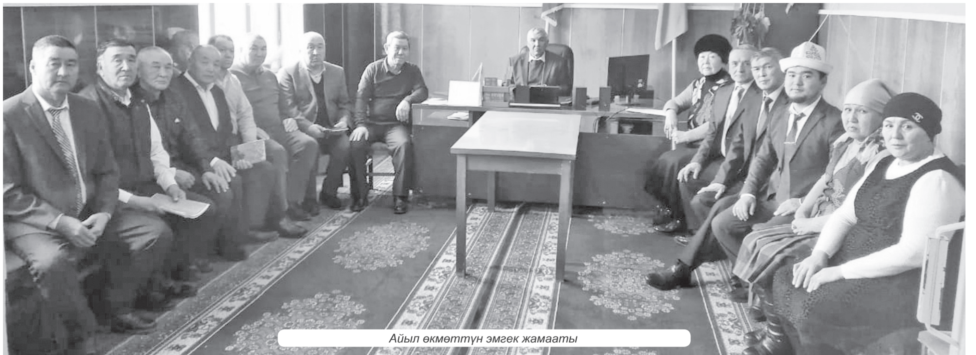
Айыл өкмөттүн эмгек жамааты