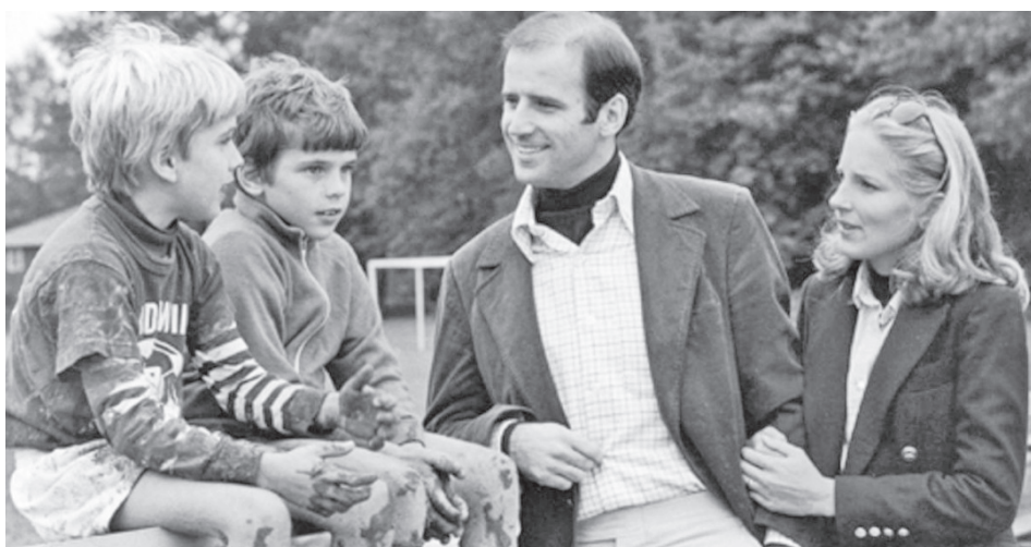
Джо менен Джилл баш кошкондо Байденден балдары 7 жана 8 жашта болчу.

Шамшинский айыл окмоту Чуйского района ОБЪЯВЛЯЕТ О ПРОВЕДЕНИИ АУКЦИОНА по предоставлению земельных участков из муниципальной собственности по следующему контурам: