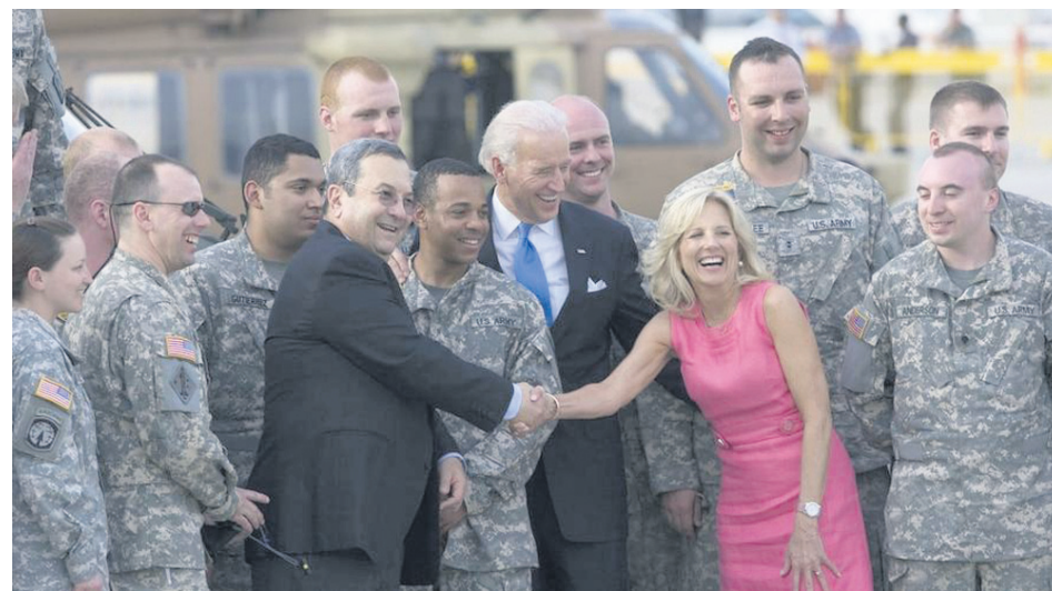
Джо Байдендин инаугурациясында ал күйөөсүн Техаска коштоп барган.