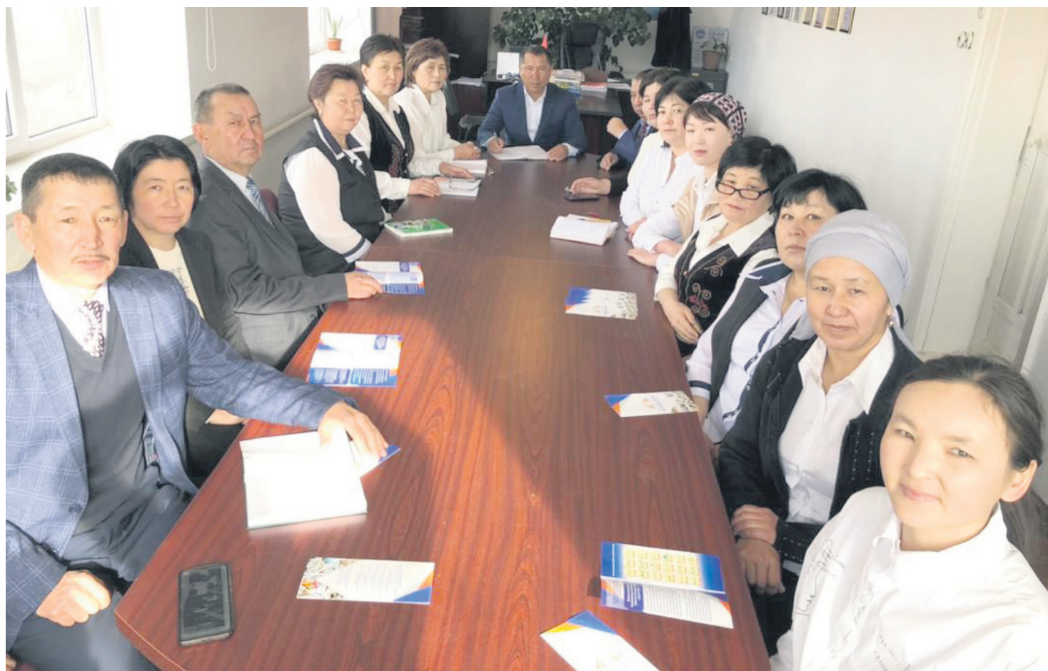
Айыл өкмөттүн эмгек жамааты.

Айыл аймагынан жумасына 6 жолу таштандылар чыгарылат жана Э. Матыев атындагы борбордук көчө шыпырылып ирээтке келтирилип турат. Айыл аймагы боюнча ар бир айда болжол менен 50 тонна таштанды чыгарылат. Мындан сырткары, СЭС, военкомат, сот, соцфонд, айыл банк, Ауридин базары, ветлаборатория мекемелери менен келишим түзүлүп, өз убагында таштандылар чыгарылып турат. Ал эми менчик үйлөрдөн 50 сомдон чогултулуп, 1080 үй менен келишим түзүлгөн. Айыл аймагындагы кафе жана соода түйүндөрүнөн 50 ишкерге 50 сомдон, 53 ишкерге 100 сомдон келишимдер түзүлгөн. 2021-жылга план 400 000 миң сом, аткарылганы 443 900 миң сомду түздү.